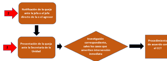
Procedimiento 2: Personal académico o administrativo como agresor

Cuando la persona o personas agresoras sean parte del personal académico o administrativo de la Unidad, la queja deberá ser presentada ante la persona que sea su jefe directo, con la finalidad de que se analice esta conducta y en su caso se inicie el procedimiento previsto en el Contrato Colectivo de Trabajo; para el último caso se deberá notificar a la Secretaría de la Unidad. En caso de que el presunto agresor sea un órgano personal, la víctima o víctimas podrán acudir directamente a la Secretaría de la Unidad para continuar el proceso.